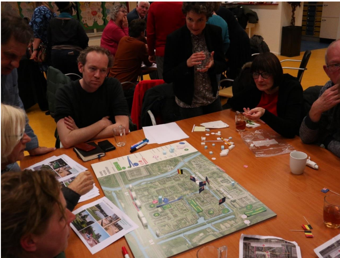
Het scenario Hou(t) Groen in de maak.